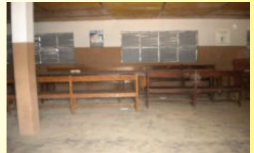
Salle de classe Gogounou