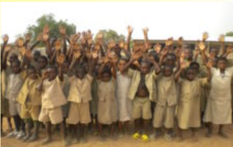
Orphelins de Gogounou