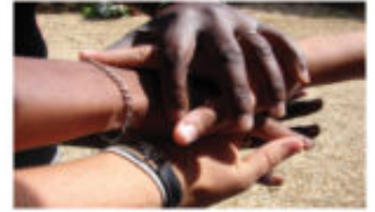
Logo Main dans la Main

Dans notre recherche de développement, nous misons beaucoup sur l'apport et l'impact de notre commerce. Nos premières actions se traduisent par une véritable présence, une écoute continue des besoins et un rôle de conseillers. Soucieux de la préservation de l'environnement, nous veillons à ce que l'utilisation de celui-ci ne porte aucun préjudice futur. Dans ce cadre, l'exploitation des noix de karité ne change pas des rites traditionnels, les noix sont cueillies seulement au sol, suite à leur chute naturelle. Territoire d'Afrique soutient l'association Main dans la Main pour Tous, qui travaille pour ce développement. Les actions menées ont pour coeur l'enseignement, la santé, et les enfants nécessiteux (orphelins). L'envoi et l'apport de matériel, les conseils et les solutions de parrainage sont un grand pas vers cet objectif ou tout simplement un sourire pour les générations présentes et à venir.