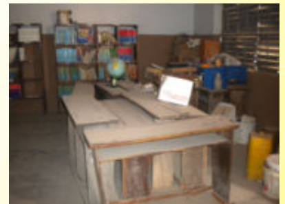
Salle de classe Gogounou